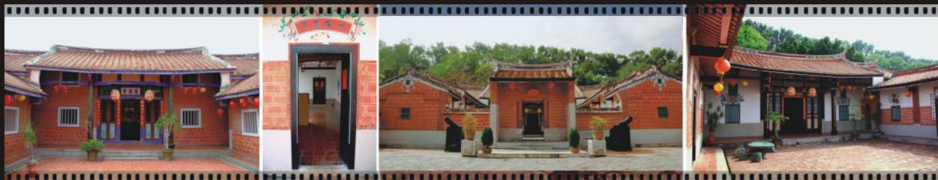
隴西堂是典型傳統的閩南建築

台灣民俗村是保存台灣建築最完整的園地，園內有許多仍古蹟建築。天水堂為客家經典建築，原宅在清道光17年建於新竹北埔，屬三合院式。原屋主具官職，故正身屋脊有官宦家特有的燕尾，建築彩繪則保有客家簡樸的風格。隴西堂則為彰化四合院建築，二進一院的格局，屋身以紅磚砌成，並覆蓋台灣紅瓦，陳設井然有序，是典型的傳統閩南式建築。